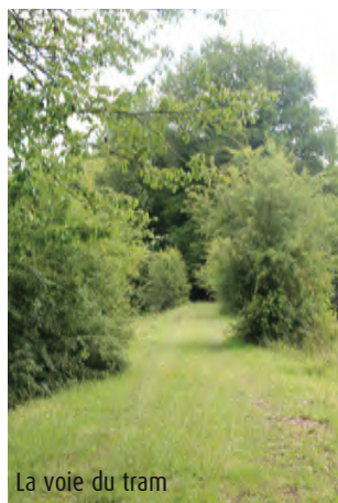
La voie du tram