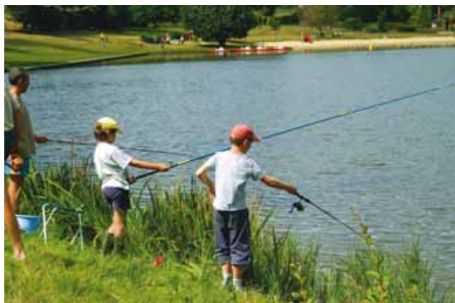
Le lac de la Roche

9 Continuer sur le chemin, passer la passerelle et tourner à droite pour retrouver le lac de la Roche. Longer le lac à gauche et retrouver le point de départ.