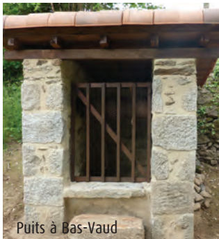
Puits à Bas-Vaud

Saint-Denis-des-Murs doit son nom au patron de la paroisse, Denis, évêque de Paris, et à la présence des murs d'un oppidum gaulois, situé près du village de Villejoubert, entre Vienne et Maulde.