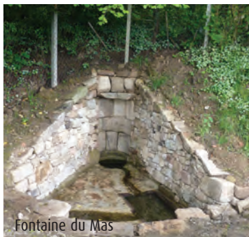
Fontaine du Mas