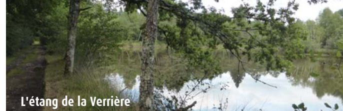
L'étang de la Verrière