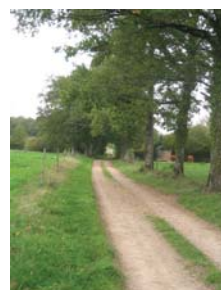
Bourg de Veyrac

Le nom de Veyrac remonte à l'époque gallo-romaine. Veyrac signifiait alors domaine de Varius. Autrefois, le roi Jean sans Terre venait chasser dans la région dans une belle forêt nommée Bernac pour narguer Jean de Veyrac alors évêque de Limoges et propriétaire du château de Veyrac. Du château, détruit à la Révolution, il ne reste aujourd'hui que la belle demeure et le pont Colombier.