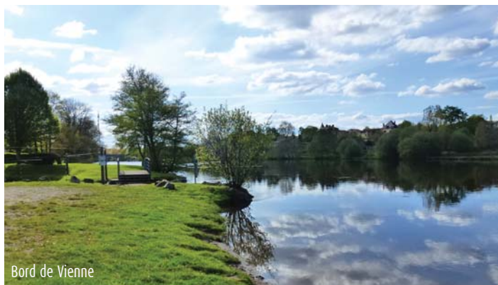
Bord de Vienne

Ses habitants sont appelés les Saint-Victurniauds. Le village est le seul entre Saint-Junien et Aix-sur-Vienne à être établi sur les deux rives de la Vienne. (Source Wikipédia)