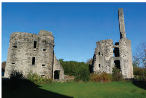
Le château des Cars

7 Contourner l'étang de pêche communal du Ronlard. Laisser le trop-plein sur votre gauche, suivre à droite le chemin sportif. Longer le parc aux daims jusqu'à l'intersection de chemins. Prendre à droite, traverser le petit ruisseau, et rejoindre l'arrière du château. Emprunter l'impasse pour rejoindre le parking à droite.