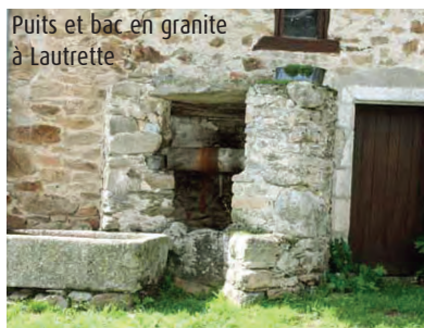
Puits et bac en granite à Lautrette

7 Au croisement, prendre à droite, traverser le ruisseau de l'étang du Mas Nadaud, qui coule près d'une motte féodale, puis remonter vers la route. La traverser et suivre en face le chemin qui ramène à la Grande Veyssière. Reprendre le circuit à gauche pour revenir au point de départ.