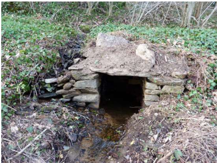
Fontaine de Gouhaut, aller-retour au point 7

9 Rejoindre la place Cardailhac en passant par la piscine municipale, la place Salvador Allende et redescendre l'avenue André Besse.