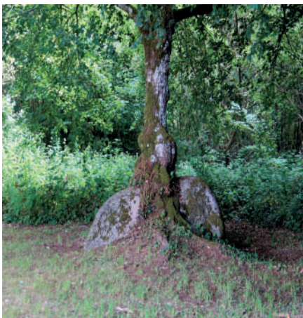
La Pierre du Diable, visible au point 6.

12 Au stop, traverser la route avec prudence pour emprunter en face la rue de Gorceix jusqu'au chemin de Sabeyroux à gauche qui nous ramène au point de départ.