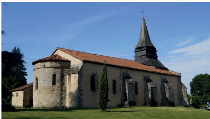
L'église Sainte-Marie-Madeleine, à proximité du départ

13 Prendre à gauche le chemin de Chanselade jusqu'au Montin, descendre à droite jusqu'au stop et remonter à droite pour revenir au point de départ.