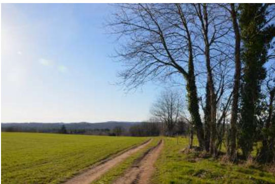
Point de vue du Communal