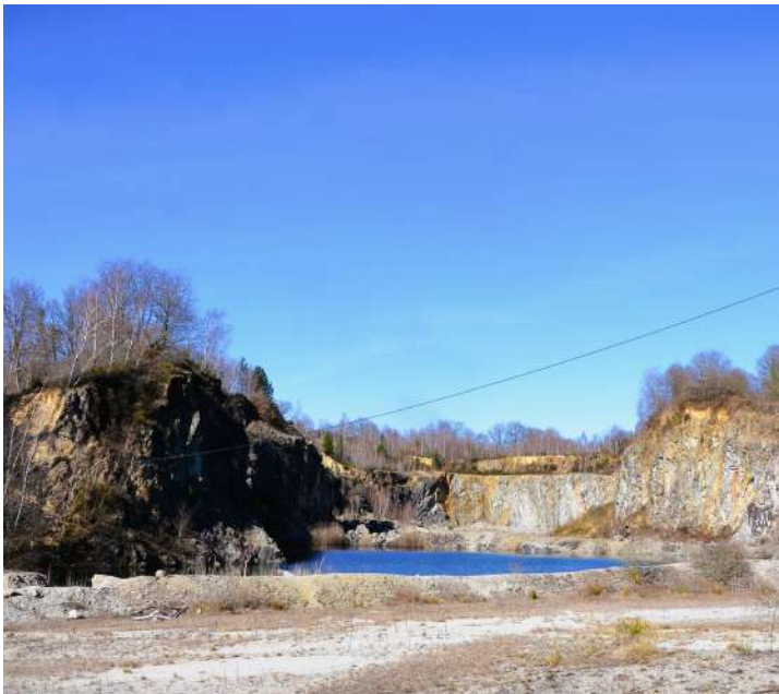
La carrière de Caux

11 Au croisement en 'T' de chemins, reprendre à gauche la piste empierrée de la carrière et retrouver à 300 m le point de départ.