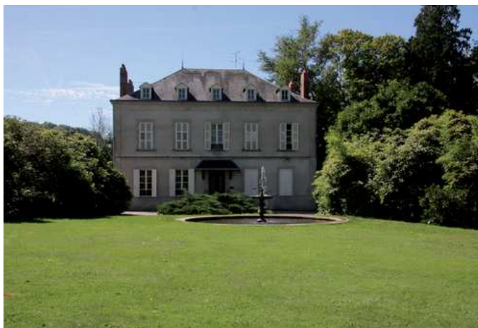
Mairie de Saint-Martin-Terressus, maison bourgeoise du XIXe siècle.