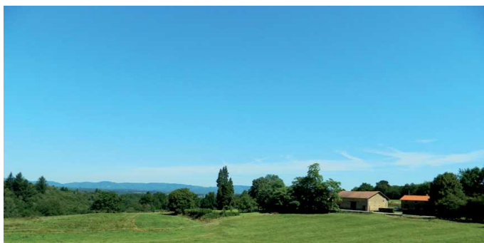
La ferme de la Teixonnière.